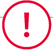
Alter: 20-49 Jahre

Die Auswertung basiert auf mehr als 1.999 Kampagnenmessungen im Zeitraum Q1 2014 – Q2 2020 .